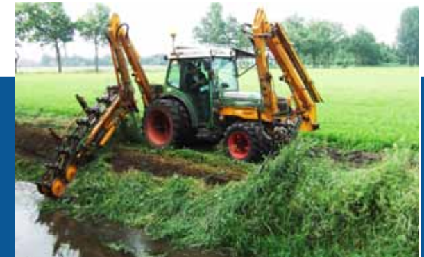
Maaien is beter dan bestrijdingsmiddelen gebruiken.

Duurzaam en milieuverantwoord beheer van sloten en slootkanten, wat betekent dat in de praktijk? Meer werk, horen wij u denken. Dat klopt. Maar dat meerwerk levert ook flink op. Naast het feit dat u bijdraagt aan waardevolle natuurwaarden, voorkomt u mogelijke boetes.