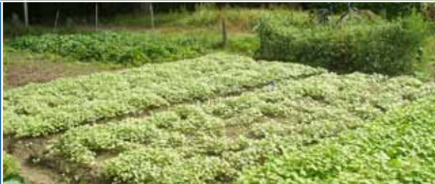
Vermijd ook bestrijdingsmiddelen bij het onderhoud van uw moestuin.