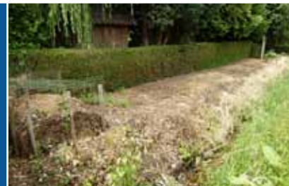
Een doodgespoten slootkant waar niets meer groeit en bloeit.

Sloten sieren het landschap, zijn het leefgebied voor planten en dieren en hebben een recreatieve waarde voor de mens. Degenen die er langs wonen of werken, genieten ervan, maar hebben er ook onderhoudswerk aan. Want de bodem en de slootrand moeten vrij blijven van onder meer overmatige begroeiing.