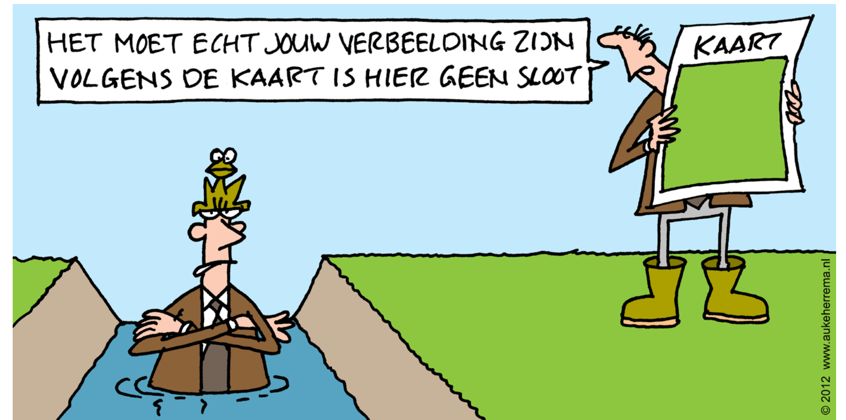
DE BASIS OP ORDE

Via wel twintig projecten leggen we daarvoor nu het fundament. Zodat jij je werk fluitend kan doen; zodat het waterschap haar doelen kan realiseren. We pakken dat samen op vanuit het volgende, leidend principe: Ik werk planmatig en maak werk van de dingen die niet op orde zijn.