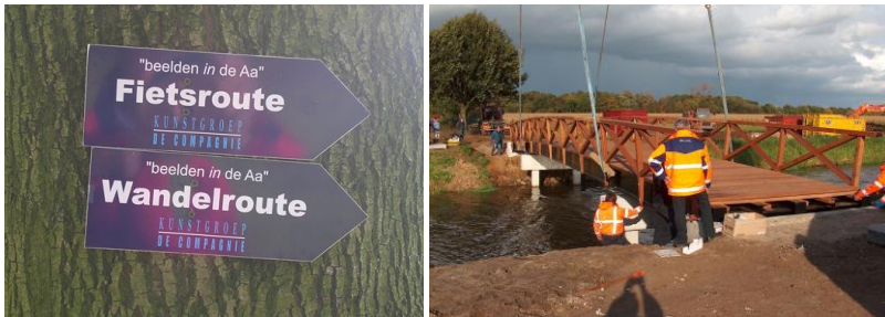
Plaatsing van een fietsbrug over de Aa in Veghel, oktober 2008.