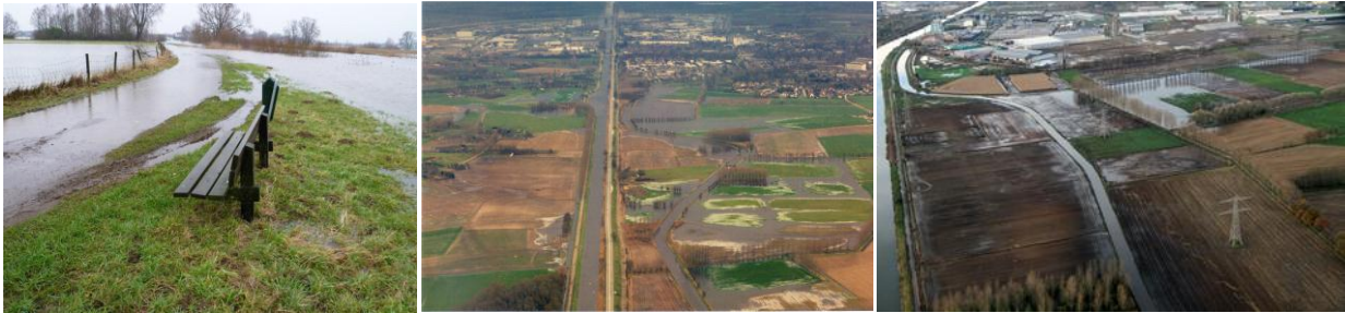
Wateroverlast: links en rechts november 2010; midden januari 2003.

Er zijn diverse raakvlakken tussen beekherstel en andere thema's, die elkaar versterken, conflicteren of neutraal zijn. Bij beekherstel bekijken we daarom uitgebreid alle raakvlakken die de maatregelen hebben. Waarop hebben de maatregelen invloed? En hoe kunnen we de mogelijkheden van beekherstel optimaal benutten en eventuele negatieve effecten zo veel mogelijk beperken?