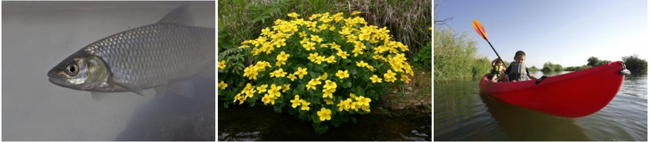
Dieren, planten en mensen genieten van de natuur.

Elke (Brabantse) beek is onderdeel van een watersysteem met (maatschappelijke) aspecten. De beken vertegenwoordigen natuurwaarden, zoals het aantal kenmerkende vis- en plantensoorten dat er leeft. Het menselijk gebruik en de daarbij gemaakte keuze bepalen de mogelijkheid voor een natuurlijke ontwikkeling. Denk aan: vinden we de waarde voor de natuur in het omliggende gebied het belangrijkste, of staat gebruik voor de landbouw voorop? Mensgerichte en natuurgerichte doelstellingen trekken met elkaar op. Ook in de meest natuurgerichte beek is er een bepaalde vorm van menselijk gebruik mogelijk; en in landbouwgerichte wateren zijn er voldoende mogelijkheden voor de natuur.