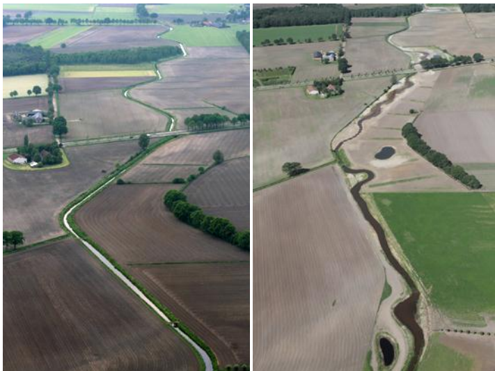
Voorbeeld van beekherstel: de Kaweise loop voor (links) en net na afronding van het beekherstelproject.

Het waterbeheer focuste tot ongeveer 1990 vrijwel geheel op het voorkómen van wateroverlast in natte perioden én op de aanvoer van water in droge perioden. Inrichting van de oorspronkelijke beken was alleen gericht op waterafvoer en efficiënt onderhoud. Beken kregen daardoor het karakter van sloten en weteringen. Zo is een aantal bovenlopen doorgetrokken naar bijvoorbeeld het Peelkanaal om aanvoer van water uit de Maas mogelijk te maken. Hierdoor zijn typische natuurwaarden, zoals (stromingsminnende) planten en vissoorten (denk aan dotterbloemen en kopvoorn) van beken verloren gegaan en is de waterkwaliteit veranderd. Tegenwoordig is de opgave van het waterschap breder: denk aan verdrogingbestrijding en het voorkómen van extreme piekafvoer benedenstrooms. Daarnaast neemt het waterschap in toenemende mate verantwoordelijkheid voor de kwaliteit van natuur en landschap.